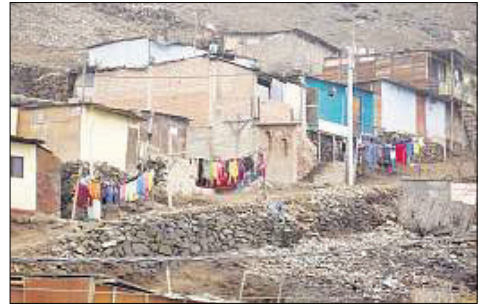
An den Hängen von La Ensenada entstehen ganze Armensiedlungen durch Besetzer.

Einige Neuigkeiten der Gemeinde: Zuerst die Freude, dass wir einigen Besuch bekommen haben: Eine Heilgymnastin aus Ka-