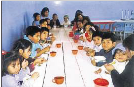
Jeden Tag werden rund 600 Essen an Kinder, Alte und sonstige Bedürftige ausgegeben.