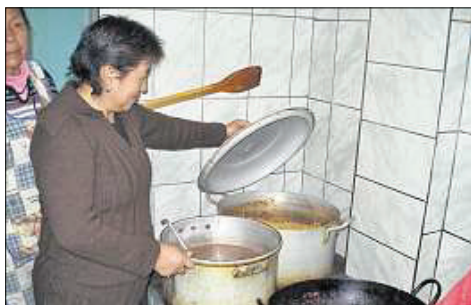
Die Frauen kochen mit einfachen Mitteln, um mit wenig Geld viel zu erreichen.

ses Programms haben festgestellt, dass nach einigen Jahren der kurzen Windstille, die so genannten ‚Pandillagruppen‘ wieder zu neuen Kräften gekommen sind, mit noch jüngeren Kindern. Man muss nun die Anstrengungen bei den Eltern genau wie bei den Kindern verdoppeln. Die Eltern haben Schwierigkeiten damit, zu akzeptieren, dass ihre Kinder Teil einer Gruppe dieser Art sind, denn sie sind manchmal den ganzen Tag weg. Ansonsten gibt es bei unseren Sozialprogrammen weder Neuigkeiten noch schwerwiegende Probleme. Das Schutzhaus beherbergt zwischen 8 und 15 Kinder. Das Ausbildungsprogramm wird eine neue Vorladung von Jugendlichen veranlassen, die hier eine persönliche Ausbildung erhalten werden und die wir mit einem Stipendium in den technischen Zentren ab Januar 2010 einsetzen können. Den Gesundheits- und Ernährungsprogrammen fehlt es nie an Kunden. Und aufgrund der Landpachtung der letzten Monate gibt es genügend Nachfragen für die Baumaterialien für Hütten. An diesen Hängen ohne Schutz frieren sie noch mehr als wir.“ Ira Herkommen