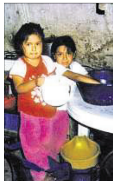
In der Herberge sind Ausgestoßene untergebracht.

● Spendenkonto der Peru-Hilfe: Konto 800 001 508, BLZ 614 500 50 Kreissparkasse Ostalb, Infos unter www.peru-gruppe-heubach.de und bei Gerhard Ritz in Heubach, Telefon (0 71 73) 56 54.